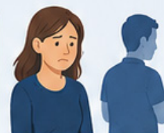
Mises à l'écart et isolement