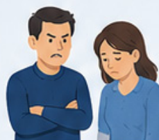
Humiliations et dénigrement